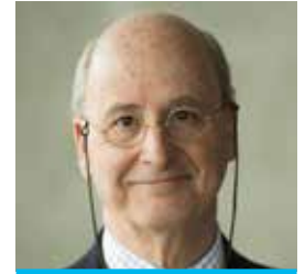
Stéphane Garelli Weltweit anerkannte Autorität für Wettbewerbsfähigkeit