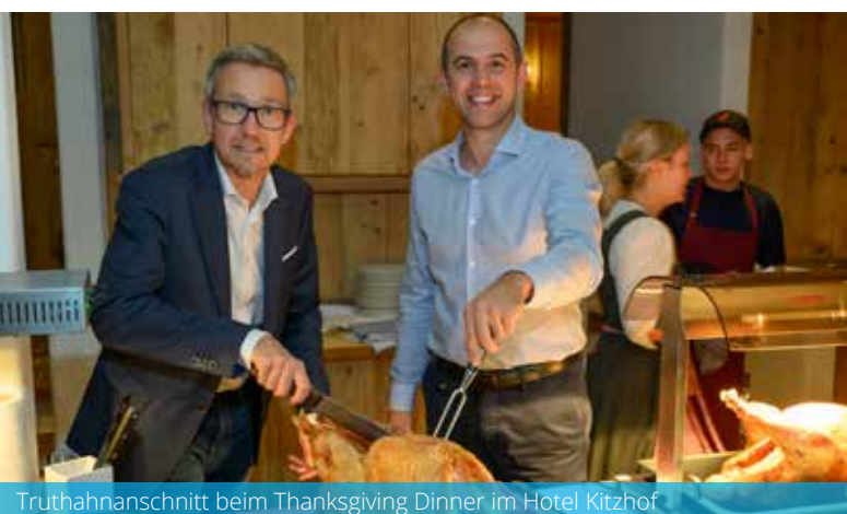
Truthahnanschnitt beim Thanksgiving Dinner im Hotel Kitzhof