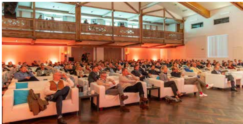
Der große Saal bietet entspannte Atmosphäre für die zahlreichen inspirierenden Vorträge