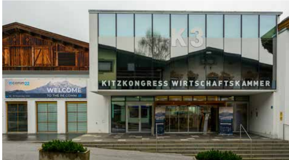
Der K3 Kitzkongress im Herzen der Alpenmetropole bietet das perfekte Setting