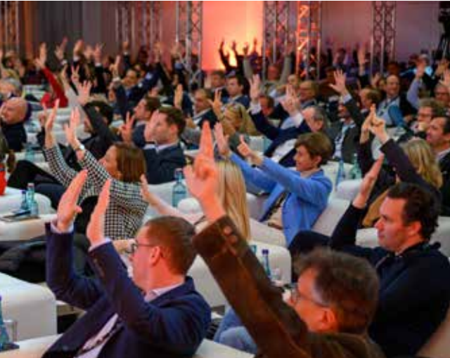
280 Top-Player der Immobilienbranche erwarten neue Inspirationen