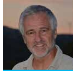
Ramón Méndez Galain Architekt der Energiewende Uruguays