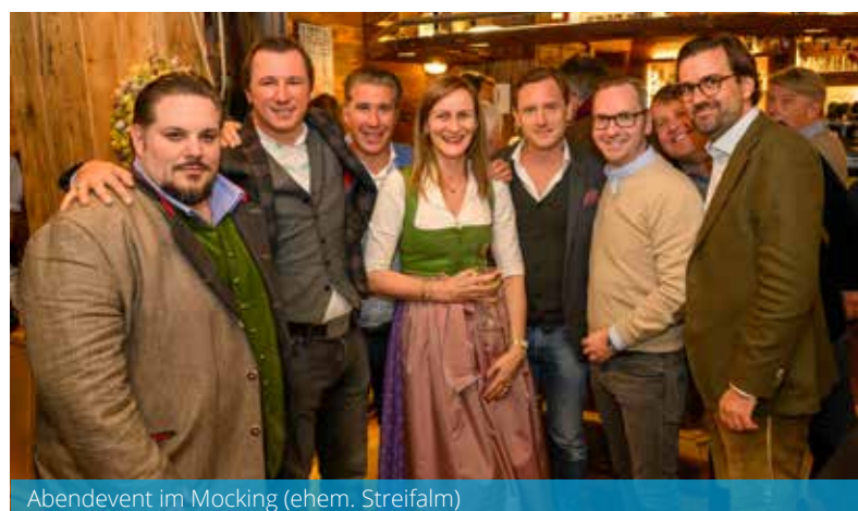
Abendevent im Mocking (ehem. Streifalm)