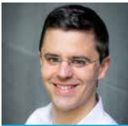
Gernot Wagner Experte für Umweltwissen- schaften, öffentliche Politik, Wirtschaft und Regierung