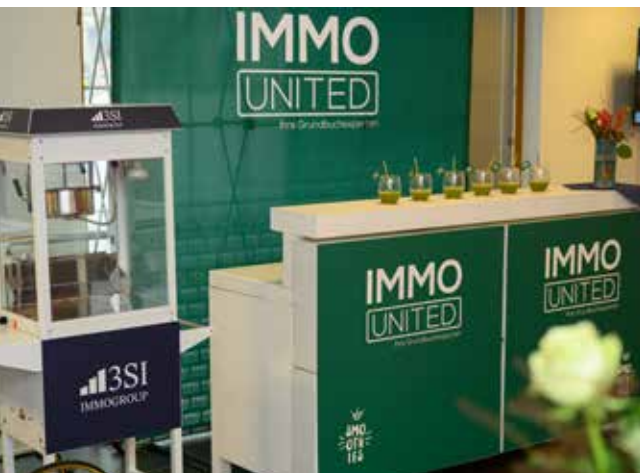
3SI Popcornwagen und Smoothie-Bar von IMMOUnited