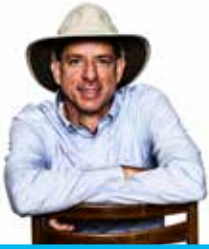
John Strelecky Erfinder „Big Five for Life“