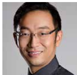
Li Jiang Leiter des Stanford AI/RE-Programms, Experte für KI, Robotik und Bildung