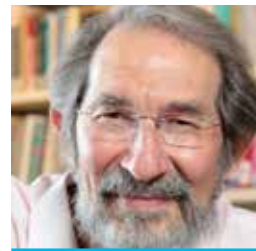
Geoffrey West Physiker, Pionier der Komplexitätsforschung